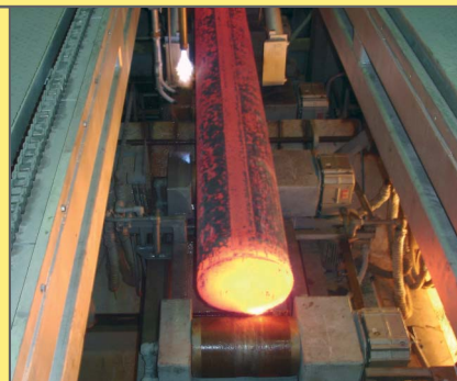
Rollgangs-antrieb mit wassergekühlten Kegelflachgetriebemotoren

Weitere Informationen, das WATT Produktprogramm betreffend, erhalten Sie auf unserer Website unter www.wattdrive.com .